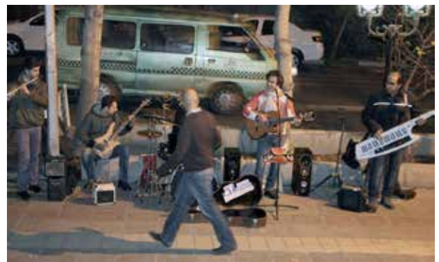
تصویر ۷. محل استقرار نوازنده خیابانی در مسیر پیاده خیابان انقلاب عکس: آناهیتا مدرک، ۱۳۹۵.