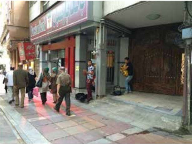
تصویر ۶. نوازندگان خیابانی به سبک محلی در مسیر پیاده خیابان ولیعصر. عکس: آناهیتا مدرک، ۱۳۹۴.