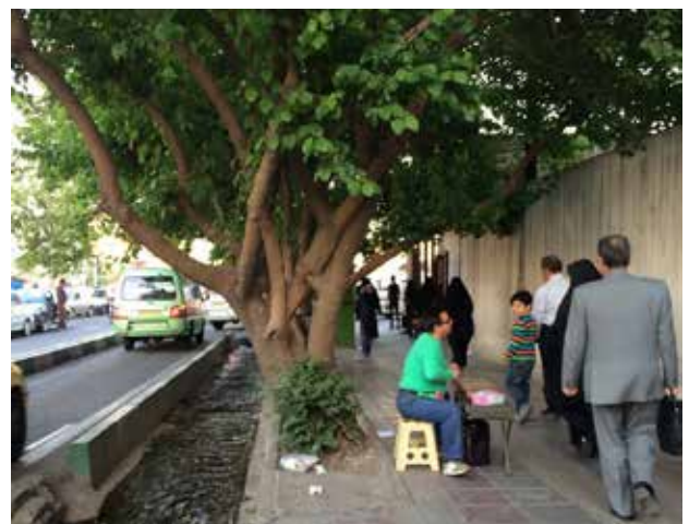
تصویر ۹. نوازندگان خیابانی به سبک محلی در مسیر پیاده خیابان ولیعصر بالاتر از میدان ونک. عکس: آناهیتا مدرک، ۱۳۹۴.