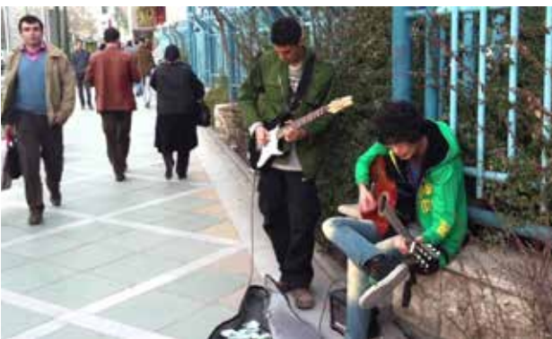
تصویر ۸. محل استقرار نوازنده خیابانی در مسیر پیاده خیابان ولیعصر عکس: پریچهر اصل فلاح، ۱۳۹۵.