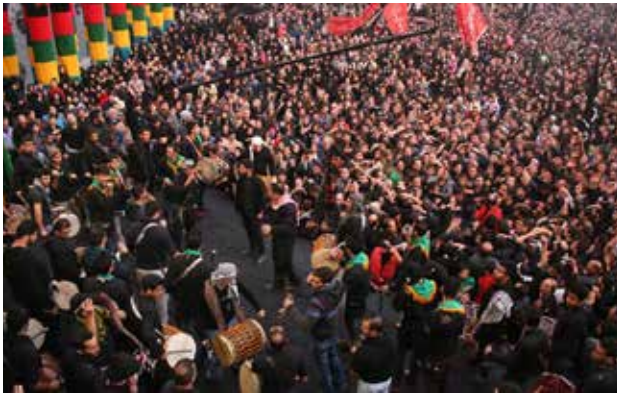
تصویر ۱. مراسم عاشورا در میدان امام حسین، تهران.