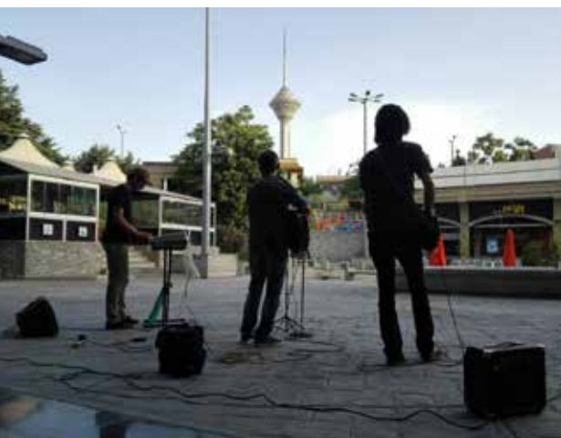
تصویر ۱۰. محل استقرار نوازنده خیابانی در مرکز خرید گلستان - تهران عکس: آناهیتا مدرک، ۱۳۹۵.