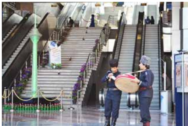
تصویر ۳. مراسم نوروزی در مقابل برج میلاد.

داشته است. در این دوره، نوازنده‌های دوره‌گرد معمولاً به همراه حیوانات در همه‌جا دیده می‌شدند (همان). از این زمان به بعد، واژه «لوطی» به تاریخ موسیقی خیابانی افزوده شد. در واقع، لوطی به مطربان، رقاصان و حیوان رقاصان های دوره‌گرد و یا به طور کلی، به معرکه‌گیران اطلاق می‌شد (همان). این دسته از نوازندگان، خصوصاً در مناسبت‌هایی همچون عید نوروز، حضور پررنگ‌تری در شهر داشتند و همچنین با اجرا در حیاط خانه‌های مردم نیز می‌توانستند کسب درآمد کنند. در دوران قاجار موسیقی خیابانی به شکل تعزیه بسیار مورد قبول و حمایت دربار قرار گرفت، همچنین دسته‌های موسیقی به میدان توپخانه می‌آمدند و موزیک نظامی و مارش می‌نواختند.