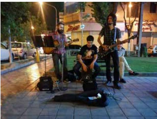
تصویر ۴. نوازندگان خیابانی به سبک مدرن در تهران. عکس: پریچهر اصل فلاح، ۱۳۹۵.

نوازندگان خیابانی، به جز کسب درآمد، هر یک دلایل و انگیزه‌های متفاوتی برای اجرا در خیابان‌های شهر دارند که باعث می‌شود علی‌رغم ممنوعیت‌ها و برخوردهای نامناسب برخی افراد و ارگان‌ها، با مداومت به کار خود ادامه دهند. تعداد معدودی از این افراد مانند زوج جوانی که بر روی پل عابر پیاده میدان هفت تیر مشغول به نواختن موسیقی سنتی ایرانی هستند، نداشتن فرصت کافی برای اجرا در سالن‌های کنسرت را دلیل اصلی اجرای خیابانی خود می‌دانند. این افراد علاوه بر فعالیت‌های تخصصی خود در زمینه هنر موسیقی، مانند تدریس موسیقی، علی‌رغم تمام شرایط نامساعد محیطی مانند آلودگی‌های صوتی بسیار در این محدوده و مخالفت‌ها، به دلیل علاقه به اجرای موسیقی میان