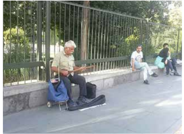
تصویر ۵. محل استقرار نوازنده خیابانی در مسیر پیاده خیابان ونک عکس: آناهیتا مدرک، ۱۳۹۵.