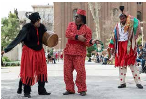
تصویر ۲. مراسم نوروزی در فضای عمومی شهر تهران. مأخذ: باشگاه خبرنگاران جوان، ۱۳۹۴.