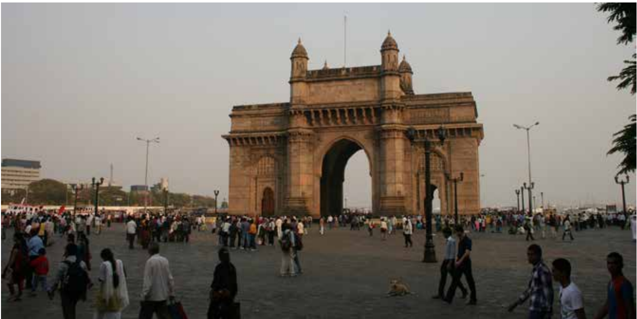
تصویر ۵. دروازه هند؛ تفکیک فراغت از سایر ابعاد زندگی هندی، عکس: منا لواسانی، آرشیو پژوهشکده نظر، بهار ۱۳۹۱.

زمان بیشتری را برای حضور در فضا اختصاص می‌دهند. ۳. فعالیت‌های اجتماعی: گفتگو و تماشای تجربه حضور دیگران و مشارکت با حضور مداوم در یک فضا اتفاق می‌افتد. در این‌گونه فضاها فعالیت‌های انتخابی زیادی وجود دارد (Gehl Architecture, 2004: 28). از میان این سه دسته،