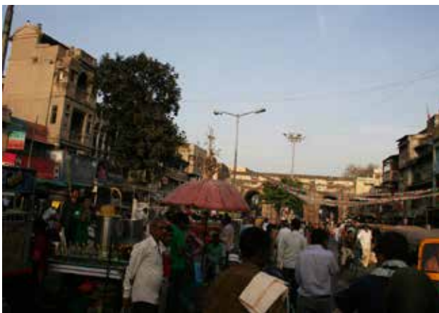
تصویر ۶. معنای پیچیده یک خیابان؛ ترکیب حرکت و مکث، کار و فراغت، سکونت و تجارت، عکس: منا لواسانی، آرشیو پژوهشکده نظر، بهار ۱۳۹۱.

زمان بیشتری را برای حضور در فضا اختصاص می‌دهند. ۳. فعالیت‌های اجتماعی: گفتگو و تماشای تجربه حضور دیگران و مشارکت با حضور مداوم در یک فضا اتفاق می‌افتد. در این‌گونه فضاها فعالیت‌های انتخابی زیادی وجود دارد (Gehl Architecture, 2004: 28). از میان این سه دسته،