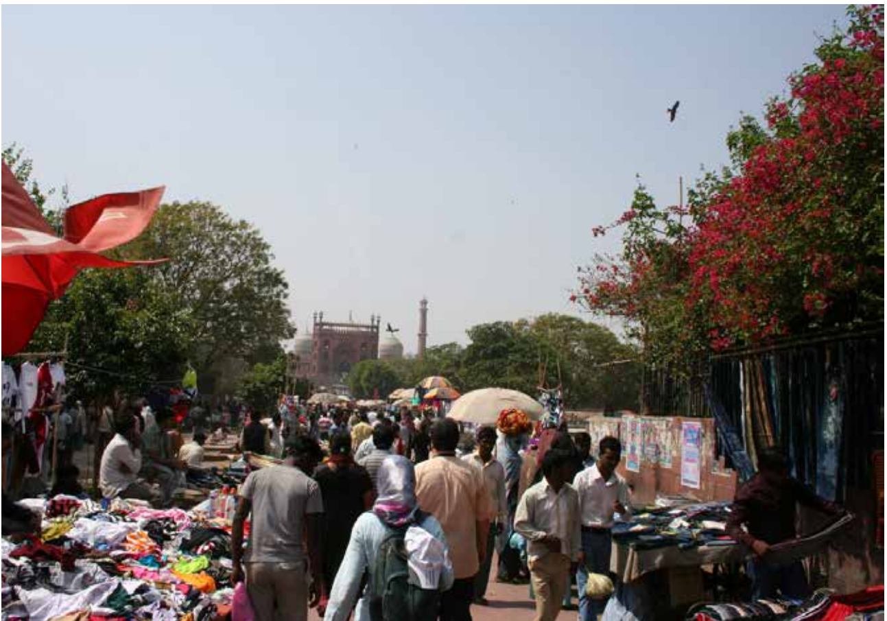
تصویر ۲. همجواری طبیعت، تجارت و مذهب؛ مسیر منتهی به پلکان مسجد جامع، عکس: منا لواسانی، آرشیو پژوهشکده نظر، اسفند ۱۳۹۰.

• فضای مدرن - تجاری، پلازای مرکز شهر - شان‌دیگار عرصه‌های پیاده در میان ساختمان‌های کاملاً مدرن Sector 17، بعد از گذشت نیم‌قرن از ساخت شهر کارکرد فضای جمعی موفقی را از خود نشان می‌دهد. پیش‌بینی فضاهای وسیع پارکینگ و ارتباط قوی شریان‌ها ویژگی تمامی نقاط شهر است. تعبیه مبلمان مناسب در این فضاهای مکث، طرح کاشتی ساده، آب‌نماها و تندیس‌ها از جمله تمهیدات طراح برای افزایش مطلوبیت فضا در گشت و گذار مردم به ویژه جوانان هنگام تماشای اجناس است. حضور گروه‌های مردمی (نظیر حامیان تبت یا فعالان مکاتب یوگا) در اینجا امری پذیرفته شده است. به طور کلی این کالبد، زندگی و تفکر غربی منبعث از آن را دیکته کرده و تا حدی توانسته به عنوان یک ظرف، مظروف خود را هدایت کند. با این حال دستفروشی و حضور افرادی از طبقه پایین نظام هندو که از خصایص تمام فضاهای شهری هند است، در اینجا نیز به طور