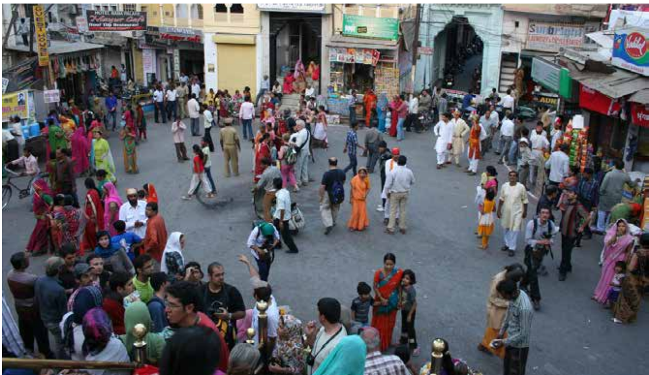
تصویر ۴. میدان مجاور معبد جاگدیش ادیپور در پایان جشنواره ماوی، بهار ۱۳۹۱.

– این حضور از آغاز روز تا فرارسیدن ساعات اولیه شب ادامه داشته و به فراخور کاربری‌ها در برخی ساعات افزایش می‌یابد. – به تبع همین حضور و مطابق مشاهدات نگارنده، غالب فضاهای شهری هند از امنیت نسبی خوبی برخوردار بوده و این ویژگی در سایه فرهنگ و آموزه‌های مذهبی تقویت نیز می‌شود. – به نظر می‌رسد ویژگی‌های کالبدی نظیر میزان محصوریت،