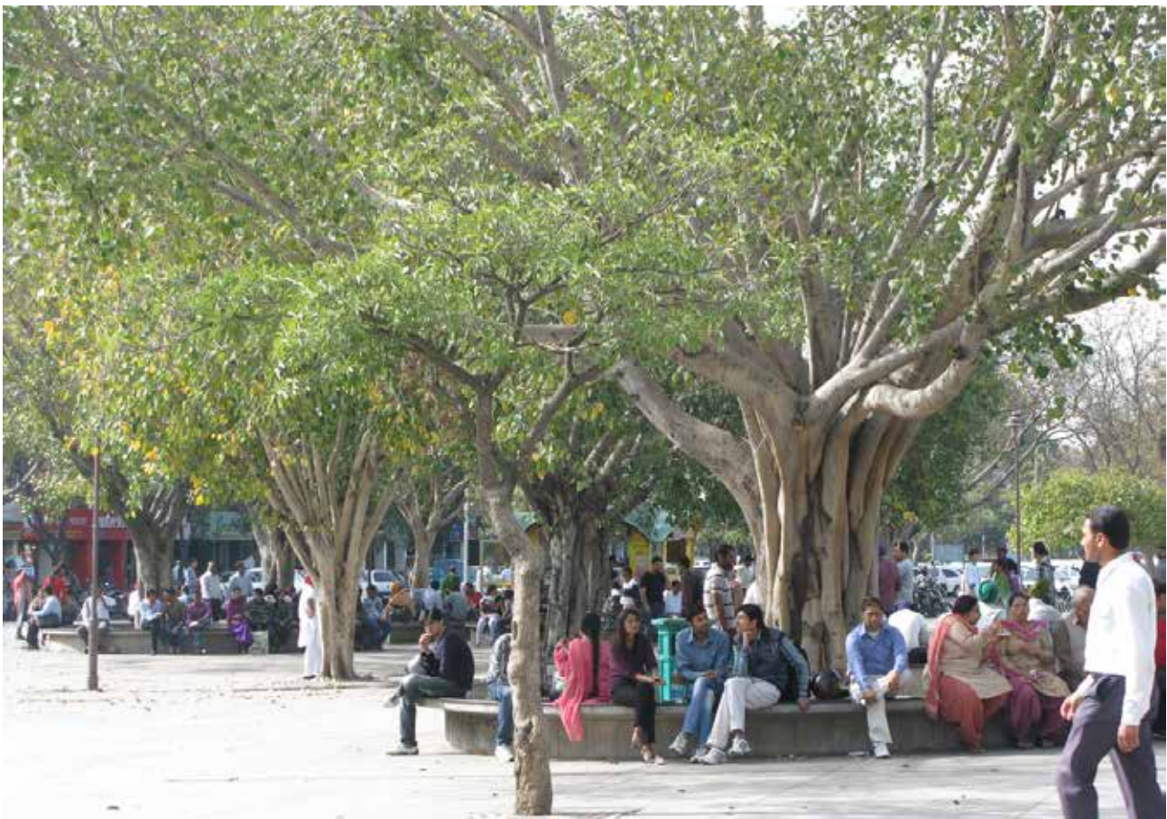
تصویر ۳. پلازای مرکز شهر شاندیگار در حکم یک فضای جمعی موفق، عکس: منا لواسانی، آرشیو پژوهشکده نظر، اسفند ۱۳۹۰.

محوطه این بنای یادمانی که در اوایل قرن بیستم در دماغه کوچکی کنار خلیج ساخته شده، با یک قطعه فضای سبز به شهر متصل می‌شود. خاطره خروج آخرین نیروهای انگلیسی از هند، جذابیت همجواری با آب و سبک انگلیسی بافت مجاور (نظیر هتل تاج‌محل) از جمله نقاط قوت این فضا است که با مبانی نظری فضاهای جمعی انطباق دارد. با توجه به وسعت فضا و فاصله از کاربری‌های جاذب جمعیت، عمده عملکرد این فضا فراغتی و تفریحی است؛ نشستن و تماشای اطراف، فعالیت عکاسان و فروش تنقلات جریان زندگی این فضا است که با جنس بیشتر فضاهای شهری هند متفاوت است (تصویر ۵).